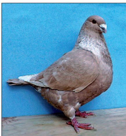
Mladá holubice redukovaná červená

ření, který vydala komise EE. Není mým účelem zde popsat vzorník plemena, ten lze nalézt podrobný s dalšími informacemi na webu klubu: www.american-gianthomers.com , ale jen seznámit s několika novinkami v klubu a vystavením gigantů na poslední výstavě mladých holubů USA. Chci jen připomenout, že velký důraz se klade na kondici, která je též jako samostatná pozice ve vzorníku. Ta ovlivňuje nejen vzhled holuba, ale též jeho správné posouzení. Holub nemůže být hubený ani tlustý, musí být svalnatým „atletem“, který je navíc ostražitý a zároveň při posuzování i klidný, což se též hodnotí.