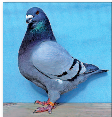
Modrý pruhový holub (2015)