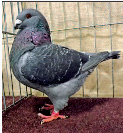
Nejlepší holubice modrá tmavá kapratá (2014)

Minulá výstava nebyla výjimkou a ukázala plemeno v mnoha