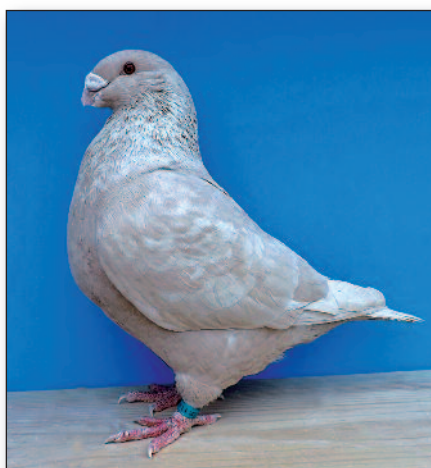
Redukovaná červená (0,1) chovatel: J. Plowdry