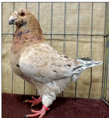
Mandlový holub (2014)