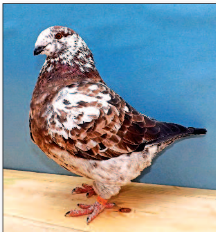
Šampion – (0,1) kite grizzle (2015)