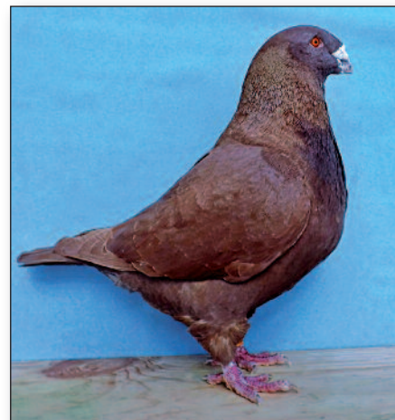
Holub recesivní červený

nulá kresba standardu, jejímž autorem byla známá D. Jacky, byla vytvořena r. 1980, byla klubem nyní změněna za novou, jejímž autorem je G. Romig. Vzorník v podstatě nedoznal změn v textu, v kresbách je však již vidět malý rozdíl, holub se stává výraznější v typu a lépe ukazuje ideál a směr šlechtění, který bude klub tomuto plemeni udávat.