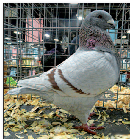
Holub popelavě červený pruhový chovatel: J. Plowdry