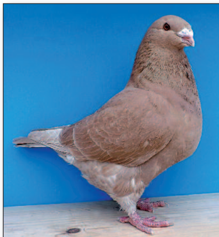
Holubice de Roy