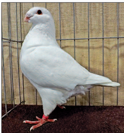
Šampion – bílý holub (2014)

Každý standard prochází časem různými změnami a zdokonalováním plemena. Kresba holuba a jeho standardu se zde měnila v návaznosti na stupeň a též cíle směru šlechtění. Mi-